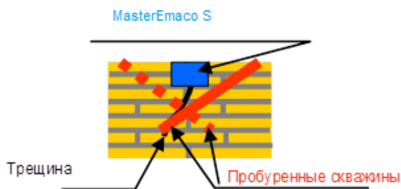
Рисунок 1 Примерная технология инъекции трещин.